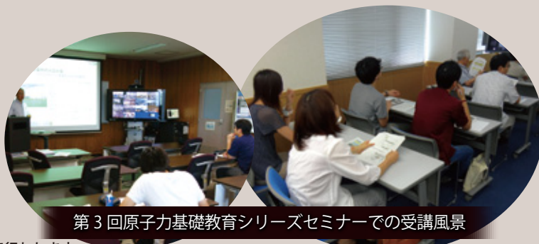
第3回原子力基礎教育シリーズセミナーでの受講風景

*この事業は文部科学省「平成26年度 原子力人材育成等推進事業費補助金」によって行われます。