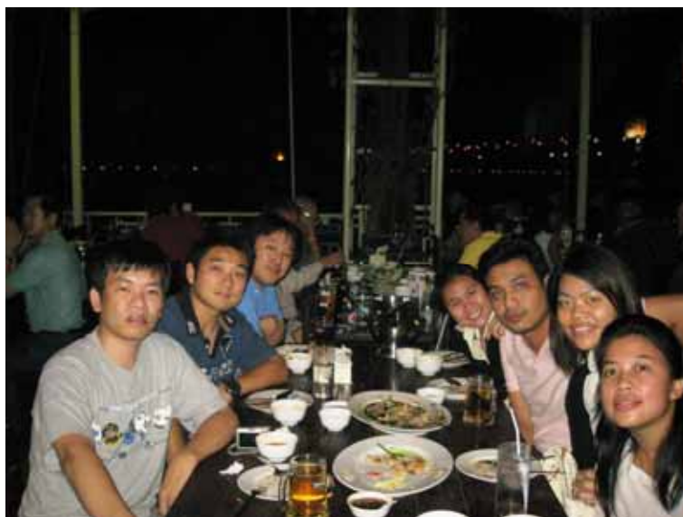
写真3 チュラロンコン大学の学生とチャオプラヤ川沿いのレストランにて

最後に、このような非常に素晴らしい機会を与えて下さった先生方、COE事務局の方々を含め、全ての方にこの場を借りて感謝したい。