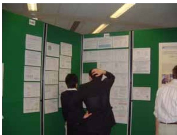
図2 ポスター発表会場にて

近年、核融合トカマク研究において内部輸送障壁を伴う高圧力の負磁気シアプラズマは定常化に適した運転モードとして注目されているが、一方で、放電停止を招く崩壊現象が発生し易い。その物理機構は解明されていないが、日本原子力研究所の大型トカマク装置 JT-60U の高性能負磁気シアプラズマ実験で速い電流消滅が観測されている。その為、プラズマ崩壊現象の特性を調べ、その背景機構を明らかにする必要がある。そこで、我々は、JT-60U の内部輸送障壁を伴う高圧力の正磁気及び負磁気シアプラズマ