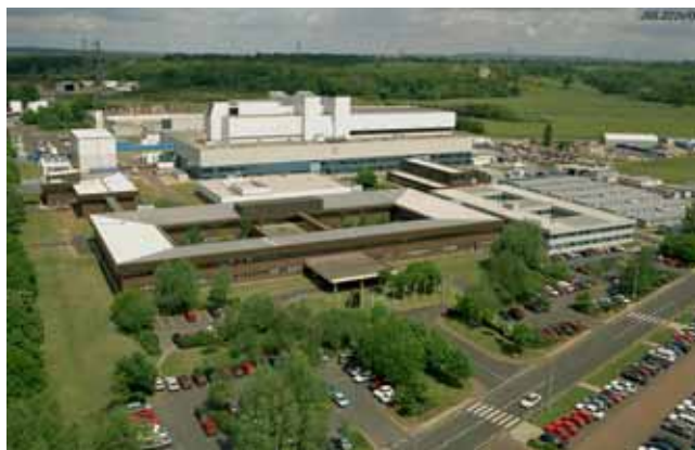
図5 カラム研究所の中の JET サイト

本滞在中、JET の実験に参加されている女性の若手研究者と崩壊現象について議論を行なった。JET の実験では、熱消滅は生じたが、電流消滅には至らない時に、内部インダクタンスの変化が観測されない放電があるということであった。JT-60U と JET のこの現象の違いが何であるか突き止めるには、両装置の実験データを比較検討する必要があることから、今後、直接的な研究協力を含め、議論を進めていく予定である。