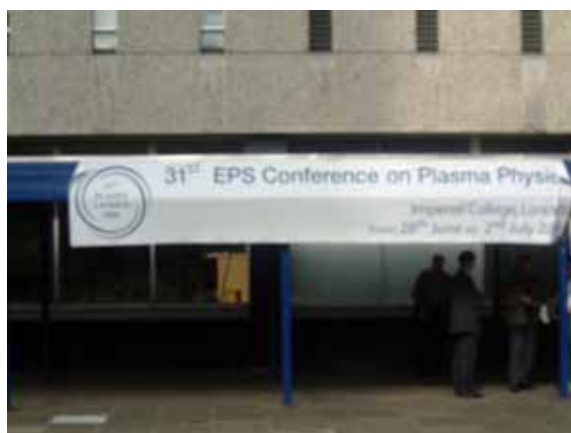
図1 Imperial College

6/28 - 7/2 にロンドンの Imperial College で開催された、「31st European Physical Society Conference (EPS) on Controlled Fusion and Plasma Physics」に参加した。(図1) 今回は、1010 件の発表があり、内 56 件が招待講演、98 件が口頭発表、856 件がポスター発表であった。会議でのカテゴリー毎の発表件数は、